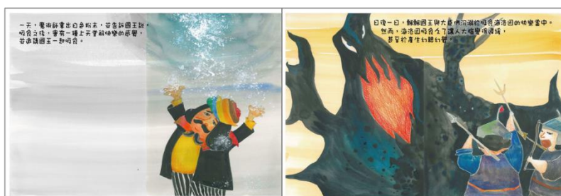
※範例作品：教育部反毒繪本—飄飄王國滅亡記/洪孟真、呂舒婷